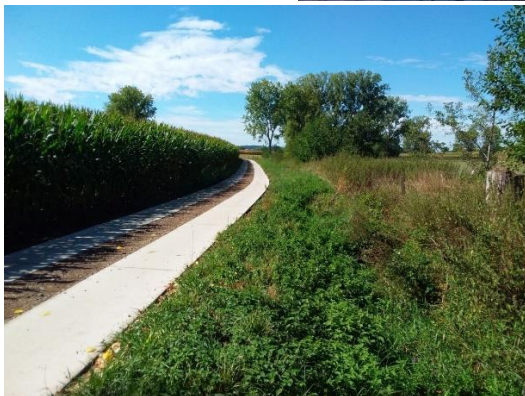
Foto: Fietspad Hollebeekstraat-Breebijn.

Deel Hollebeekstraat (Brakel) is reeds aangelegd in tweesporenbeton en Lierde zal hierop aansluiten.